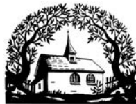
Gemischter Chor Tuttwil

Das Lords-Meeting-Team www.evang-waengi.ch